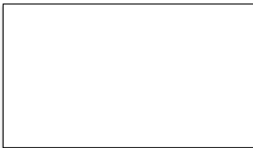
Fotografía 4: descripción