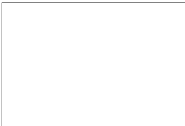
Fotografía 3: descripción