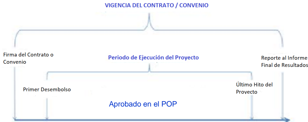
Figura 1. Vigencia del contrato o convenio y del Project