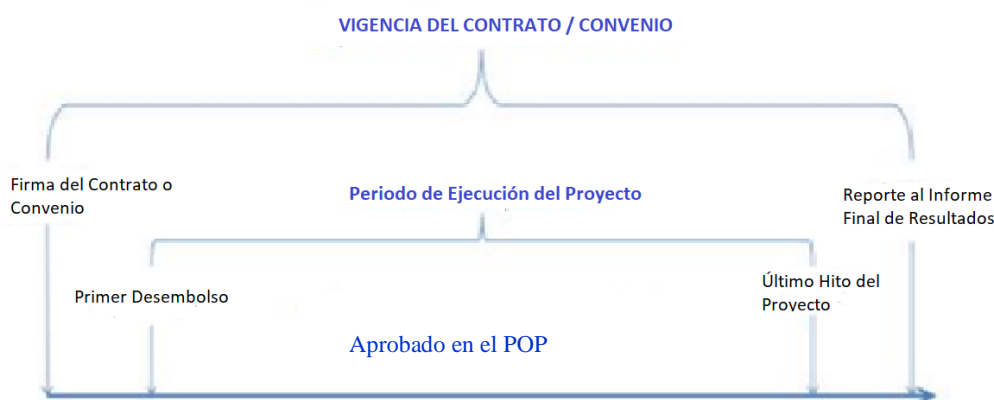
Figura 1. Vigencia del contrato o convenio y del Proyecto