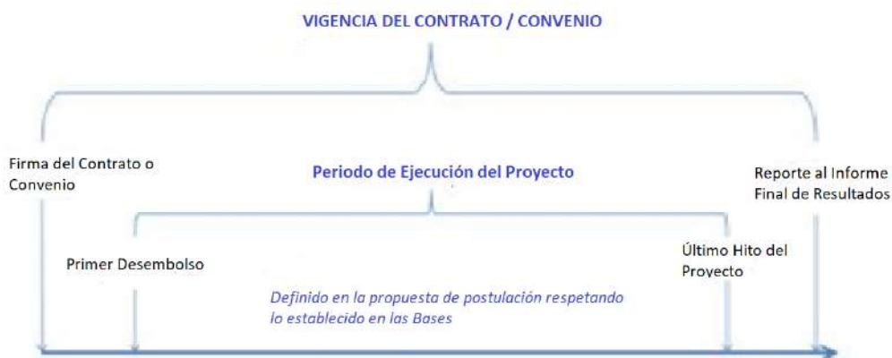
Figura 1. Vigencia y Periodo de Ejecución