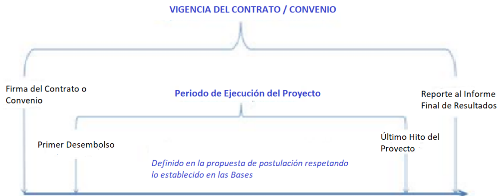
Figura 1. Vigencia y Periodo de Ejecución